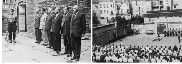
Bild links: Prominente aus Politik und Rundfunk bei ihrer Einlieferung in das KZ Oranienburg, darunter die SPD-Politiker Ernst Heilmann (r.) und Friedrich Ebert junior (2. v. r.), August 1933 (Propagandaaufnahme).